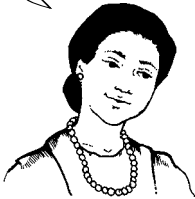
Una partera no debe decirle a nadie lo que ella sabe acerca de una mujer.

Nunca le contaré a nadie más lo que me dijiste.