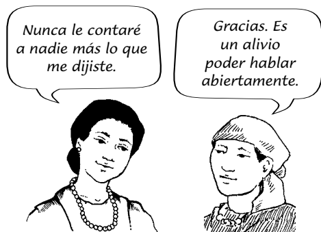
Una partera no debe decirle a nadie lo que ella sabe acerca de una mujer.

Nunca hable con nadie más sobre la salud y los cuidados de otra persona, a menos que esa persona le dé permiso. Y cuando hable con las mujeres acerca de su salud, hágalo en un lugar privado, donde los demás no las puedan oír.