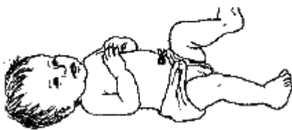
بلي! لته هاي طفل پايينتر از ناف بسته شده است.