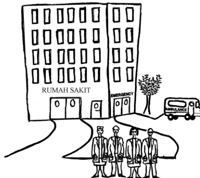
Dokter Umum, Perawat dan Dokter Spesialis

Tidak semua daerah memiliki semua jenis pelayanan kesehatan. Walaupun terdapat kombinasi dari berbagai jenis pelayanan kesehatan, para perempuan (dan beberapa orang sakit) akan mendapatkan pelayanan kesehatan yang baik jika semua jenis pelayanan kesehatan saling berkerjasama dengan baik.