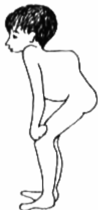
នៅពេលឆ្អឹងជំនី ពត់ចុះក្រោមខ្នង ពេលនោះកុមារអាចទប់ខ្លួនរបស់គេដោយប្រើប្រាស់ដៃទាំងពីរ ។

ប្រសិនបើ ចំណុចកណ្តាលខ្នងរបស់កុមារ មានការវិវត្តន៍ទៅរកការកោងខ្លាំង រួមជាមួយទ្រូងទន់ហើយរឹង គេសន្មតថាជាជំងឺរមេងឆ្អឹងជំនី ។ អ្នកអាចធ្វើការសន្និដ្ឋានបានថាក្នុងក្រុមគ្រួសាររបស់អ្នក មានម្នាក់កើតជំងឺរមេងសួត ។