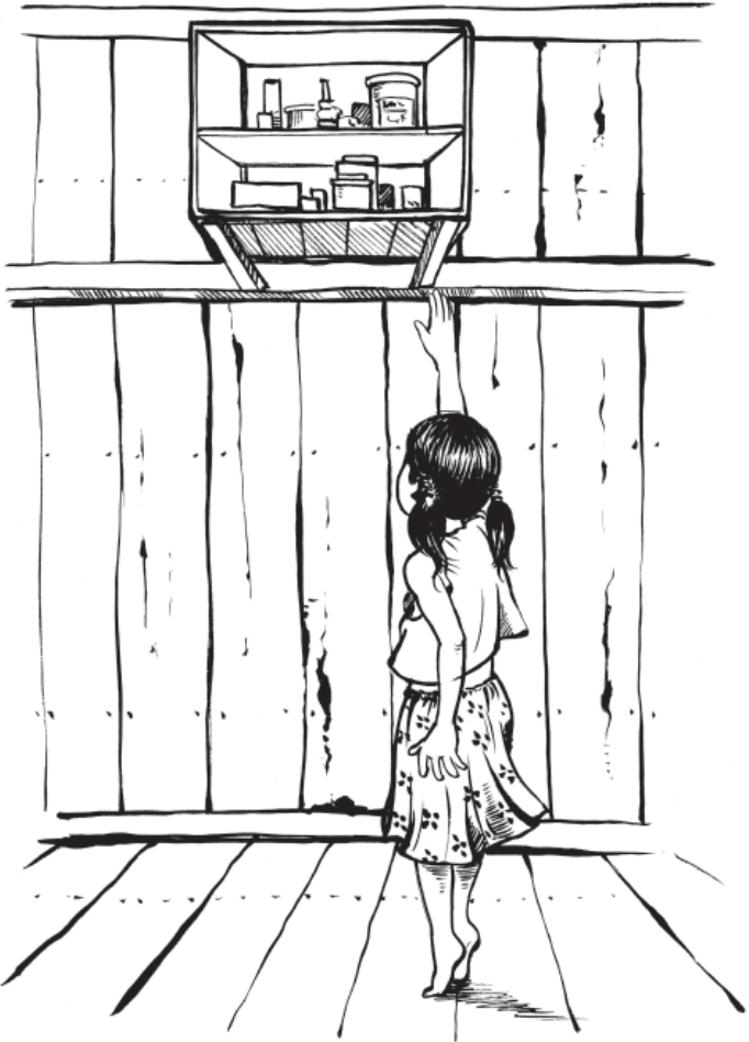
ទុកដាក់ថ្នាំពេទ្យឲ្យផុតពីដៃកុមារ។

ចំណាំ៖ ថ្នាំខ្លះ ជាពិសេសថ្នាំតេត្រាស៊ីគ្លីន អាចមានគ្រោះថ្នាក់យ៉ាងខ្លាំង បើវាហួសកាលបរិច្ឆេទប្រើប្រាស់។ ទោះជាយ៉ាងនេះក្តី ថ្នាំប៉េនីស៊ីលីនក្នុងទម្រង់ស្ងួត (គ្រាប់ ឬម្សៅសម្រាប់ទឹកស្ទើរ ឬសម្រាប់ចាក់) អាចប្រើបានរហូតដល់១ឆ្នាំបន្ទាប់ពីផុតកាលបរិច្ឆេទប្រើប្រាស់ បើត្រូវបានរក្សាទុកនៅកន្លែងស្អាត ស្ងួត និងត្រជាក់។ ថ្នាំប៉េនីស៊ីលីនចាស់ៗ អាចបាត់បង់កម្លាំងរបស់វាខ្លះ ដូច្នេះអ្នកប្រហែលជាត្រូវបង្កើនកម្រិតប្រើប្រាស់។ (ប្រយ័ត្ន៖ ទោះបីជាការបង្កើនកម្រិតប្រើប្រាស់ប៉េនីស៊ីលីន មានសុវត្ថិភាពក៏ដោយ ការប្រើថ្នាំដទៃទៀតលើសពីកម្រិតដែលបានណែនាំ បណ្តាលឲ្យមានគ្រោះថ្នាក់យ៉ាងខ្លាំង)។