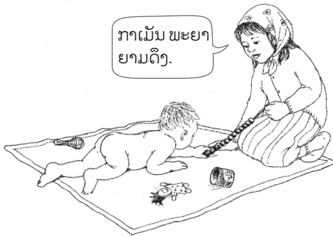
ລະມັດລະວັງລາວອາດຈະກິນກິນພວກມັນ ພວກມັນຈະຄາຄໍຂອງລາວ

ເອົາສິ່ງຂອງໃຫ້ລາວຈັບ ລາວຈະຮູ້ສຶກມີຄວາມແຕກຕ່າງກັນ ໃນແຕ່ລະອັນ ເມື່ອລາວສຳຜັດພວກມັນ, ເຊັ່ນ ທ່ອນລຽບອັນໜຶ່ງ, ເສື້ອຜ້າທີ່ບໍ່ລຽບ ແລະ ເສື້ອຜ້າທີ່ບໍ່ອ່ອນນຸ້ມ, ນອກຈາກນັ້ນ ເຈົ້າສາມາດຊຸກຍູ້ໃຫ້ລາວດຶງເອົາວັດຖຸ ເຊັ່ນ: ສາຍທີ່ມັດເຄື່ອງຫຼິ້ນແໜ້ນ ຫຼືວ່າ ເຊືອກຂອດມືນໆ. ຖ້າຫາກວ່າເຈົ້າດຶງມັນໜ້ອຍໜຶ່ງ, ລາວອາດຈະດຶງມັນຍາກຂຶ້ນ.