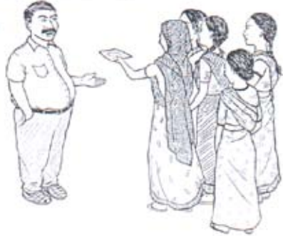
ອົງການອອກທະບຽນສະຫະກອນ

ສິດທິບຸກຄົນແມ່ຍິງ ແລະເດັກນ້ອຍ ໃນປະເທດເນປານ Protecting Women and Children's Rights in Nepal, ຫນ້າ 303,Foundation for women, Law and Development (FWLD) www.fwld.org