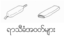
ရာသီခံအဝတ်များ

ရာသီလာခြင်းမှာခန္ဓာကိုယ်သည် ကိုယ်ဝန်ဆောင်နိုင်ပြီဟူသော လက္ခဏာဖြစ်သည်။ မည်သူမှမည်သည့်အချိန်တွင်ရာသီစတင်မည်ကိုတိတိကျကျ မသိနိုင်ကြပေ။ ပုံမှန်အားဖြင့်ရင်သားကြီးထွားလာပြီးကိုယ်ခန္ဓာတွင်အမွှေးများ စတင်ပေါက်လာပြီးသောအချိန်တွင်ဖြစ်တတ်သည်။ ရာသီမစတင်မီ လပိုင်းများ တွင်မွှေးလမ်းကြောင်းမှအရည်များဆင်းလာတတ်သည်။ အောက်ခံအဝတ်များကို စွန်းထင်စေတတ်သည်။