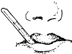
temperatura (cuántos grados)