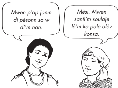
Yon fanmsaj pa dwe rakonte zafè prive yon fanm.

Se yon sèl lè w ta ka gen dwa pataje enfòmasyon sou eta lasante yon moun; sèlman avèk yon travayè lasante ki ap pran swen moun nan pandan yon ka dijans; lè sa a travayè lasante a ap bezwen konnen istwa sante fanm nan pou li ka pran swen fanm nan pi byen epi pou l ka evite danje.