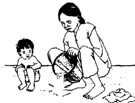
Jelaskan mengenai apa yang sedang Anda kerjakan selagi Anda mengerjakannya