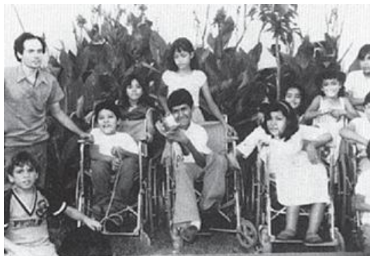
Лос Паргостогу балдардын бир бөлүгү мугалимдердин бири (сүрөттө солдо) менен. Өзү да церебралдык шалдыкка дуушар болгон мугалим балдардын муктаждыктарын жакшы түшүнөт.

Лос Паргос өздүк атайын билим берүү программасын иштеп чыгып, жергиликтүү университеттердин башчылыгын бул программаны өзүнүн негизги сабактарынан кийин коюп, күн тартибине кошуп алуусуна тартты. Волонтерлордон болгон мугалимдердин бир бөлүгү – ден соолугунун мүмкүнчүлүктөрү чектелүү адамдар. Ушундай көрүнүш балдарга абдан сонун мисал болуп иштейт.