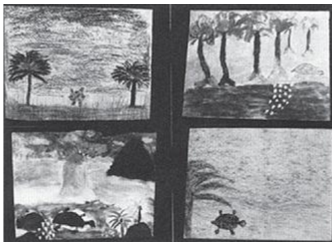
Лос Паргостогу балдар тарткан, деңиз ташбакасынын төрт сүрөтү. Алардын бул иши “Ташбакаларды сактап калалы!” деген аталыштагы чоң кампаниясынын бир бөлүгү гана эле.

Лос Паргостун жүргүзгөн иши мисал катары башка коомчолорго да жайыла баштады. Түндүк тарапта экинчи ири шаар болуп эсептелген Кулиакандагы, ден соолугунун мүмкүнчүлүктөрү чектелүү балдары бар үй-бүлөлөр өздөрүнүн буга окшогон программасын уюштурууга аракет кылып жатышат. Мындай иште ийгиликтин ачкычы болуп көп энергиялуу, буга жан дили менен берилген жана элди бириктирип иштетүүгө жөндөмдүүлүктөрү бар бир нече эле адам керек болгондой өңдөнөт.