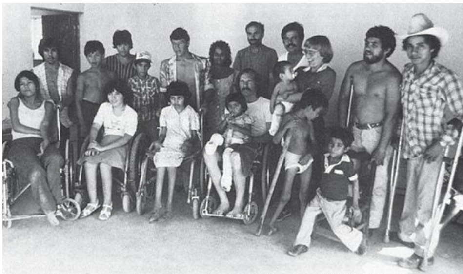
PROJIMO долбоорундагы жумушчу топтун бир бөлүгү

PROJIMO долбоору бир кичинекей айылда жайгашат, бирок жакынкы шаарлардан жана айылдардан – атүгүл чоң шаарлардан (160 км-ден алысыраак жайгашкан) – келген балдар менен алардын үй-бүлөлөрүнө да кызматын аябайт. Айылдын тургундары ошол келгин, ден соолугунун мүмкүнчүлүктөрү чектелүү балдар менен алардын жакындарын үйлөрүнө кабыл алып, долбоорго жардам беришет. Мектеп окуучулары бардык балдарга арналган оюн аянтчасын курууга жана ден соолугунун мүмкүнчүлүктөрү чектелүү балдар үчүн оюнчуктарды жасоого көмөк беришет.