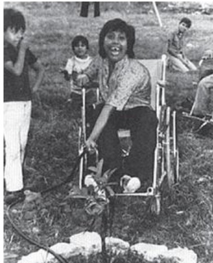
Сүрөттө, Лос Паргостон келген балдардын бири жаш даракты сугарып жатат. Бул жана башка дагы көп дарактарды балдар ата-энелери менен чогуу тигишкен.

Лос Паргос уюму PROJIMO долбоорунан болжол менен 160 км алыс жайгашат. Бирок алар буга карабастан, өз шаарында табууга дээрлик мүмкүн болбогон реабилитациялык жардам алуу үчүн, өздөрү “паркитос” деп эркелетип атаган, ден соолугунун мүмкүнчүлүктөрү чектелүү балдарын PROJIMO долбооруна улам-улам алып барып турушат. Мындан тышкары, PROJIMO долбооруна саякат учурунда шаардык бул балдар жана алардын ата-энелери убактыларын элет жергесинде аябай кызыктуу өткөрүшүп, көптөгөн жагымдуу эмоцияларга толушат.