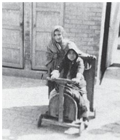
“Ары-бери айдап, сейилдеп келели”.

Пешавар программасы мотивациясы күчтүү кызыкдар адамдарды (ден соолугунун мүмкүнчүлүктөрү чектелүү балдардын ата-энелерин) бирдиктүү топторго уюштуруу иши аркылуу өлкөнүн түндүк-батышындагы чек арасына жанаша жайгашкан аймактардагы жергиликтүү коомчолордун реабилитациялык ишти өз алдынча жүргүзүүгө болгон аракеттерин колдоп, көптөгөн ийгиликтерге жетишип отурат. Алардын ийгиликке жетишүүсүнүн бирден бир себеби – “ишти адегенде жеңил нерседен баштоодо”.