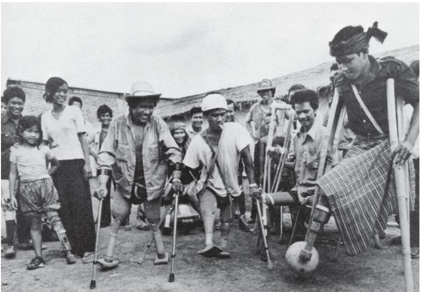
Турмушта жардам берүүчү көмөкчү жасалгалар (Healthlink Worldwide)

Дене мүчөлөрүнөн ажырап калгандар тарабынан иштелген мындай ишканалардагы мээнеттүү эмгек жана достук руху дене мүчөлөрүнөн жаңы эле ажырап калган адамдарга жоготуусуна моюн сунуп, кайрадан келечек тууралуу ойлонуп баштоосуна чоң жардам берет.