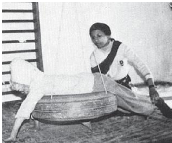
Ары-бери которулууну балага үйрөтүп баштоо.

Ден соолугунун мүмкүнчүлүктөрү чектелүү жаштар өз колдору менен ар кандай буюмдарды жасоо аркылуу үй-бүлөлөрүнө жардам берүү тууралуу макаланы бул вебсайттан ( www.independentliving.org/docs3/miles1987a.html ) тапсаңыз болот. (510-беттен мисалдарын издеңиз.)