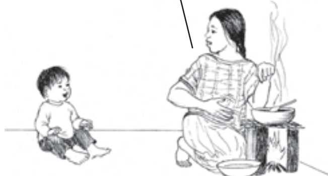
ແມ່ຂອງນາງຄຳມະນີ ກຳລັງໃຊ້ພາສາມີໃນການສື່ສານ.