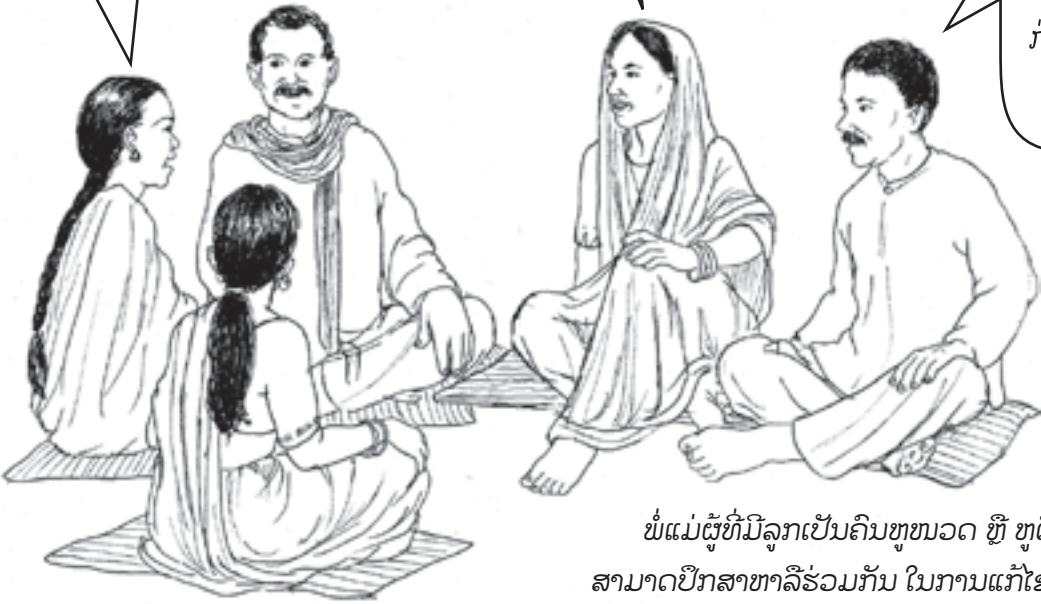
ພໍ່ແມ່ຜູ້ທີ່ມີລູກເປັນຄົນທຸໜວດ ຫຼື ຫູຜູ້ນັ້ນ ສາມາດປຶກສາຫາລືຮ່ວມກັນ ໃນການແກ້ໄຂບັນຫາໄດ້.

ນັ້ນເປັນແນວຄວາມຄິດ ທີ່ດີ! ພວກເຮົາທຸກຄົນ ລ້ວນແຕ່ຄາວງາໝົດ, ສະນັ້ນ ພວກເຮົາຈະ ບອກແມ່ຕູ້ໃຫ້ໃຊ້ວິທີດັ່ງ ກ່າວນີ້ເພື່ອຊ່ວຍລູກສາວ ຂອງພວກເຮົາ.