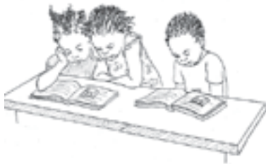
ໄປໂຮງຮຽນ ແລະ ຮຽນ ຮູ້ເລື່ອງການຄິດໄລ່ໄດ້.