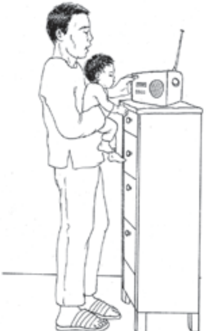
ພໍ່ຂອງເດັກຄົນນີ້ກຳລັງຈະປິດ ວິທະຍຸກ່ອນທີ່ເຂົາຈະຫຼິ້ນກັບລູກຂອງເຂົາ.

ພາວະວຸ້ນວາຍຈິດໃຈ ເຊັ່ນ: ການທີ່ເດັກຄົນອື່ນຫຼິ້ນຢູ່ໃກ້ກັບລູກຂອງທ່ານນັ້ນ ສາມາດສົ່ງຜົນການເຮັດກິດຈະກຳຂອງລູກທ່ານ ມີຄວາມຫຍຸ້ງຍາກຂຶ້ນ ຫຼື ເຮັດບໍ່ໄດ້ເລີຍ, ໃນກໍລະນີດັ່ງກ່າວນີ້ ທ່ານສາມາດຊ່ວຍໄດ້ ໂດຍການຊອກຫາສະຖານທີ່ທີ່ມີສິ່ງລົບກວນໜ້ອຍ ແລະ ພະຍາຍາມເອົາສຽງຕ່າງໆ ທີ່ບໍ່ຈຳເປັນອອກ. ຖ້າຫາກໃນຫ້ອງມີສິ່ງລົບກວນຫຼາຍ ກໍ່ຈະເຮັດໃຫ້ເດັກຜູ້ທີ່ບໍ່ສາມາດຮັບຟັງໄດ້ດີນັ້ນ ມີຄວາມຫຍຸ້ງຍາກທີ່ຈະເຂົ້າໃຈໃນສິ່ງທີ່ຄົນອື່ນເວົ້າອອກມາ.