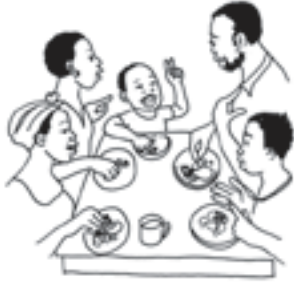
ຮ່ວມການສົນທະນາຄອບຄົວໄດ້.

ຖ້າທ່ານຫາກປະຕິບັດບັນດາກິດຈະກຳເຫຼົ່ານີ້ ໃຫ້ກາຍເປັນພາກສ່ວນໜຶ່ງໃນຊີວິດປະຈຳວັນຂອງຄອບຄົວທ່ານແລ້ວ, ລູກຂອງທ່ານຈະມີຊີວິດໄວເດັກທີ່ເຕັມໄປດ້ວຍຄວາມສະໝຸກສະໜານ ແລະ ການຮຽນຮູ້. ເມື່ອເຂົາເຕີບໃຫຍ່ຂຶ້ນມາ ເຂົາຈະສາມາດ: