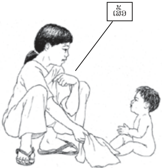
ແມ່ຂອງນາງອານິດາ ກຳລັງໃຊ້ພາສາສັນຍະ ລັກໃນການສື່ສານກັບເດັກ.