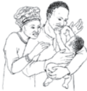
ແຕ່ງງານ ແລະ ມີຄອບຄົວເປັນຂອງ ຕົນເອງ, ນັບຈາກນີ້ເປັນຕົ້ນໄປ. ເຂົາເອງກໍ່ຈະສາມາດສົ່ງເສີມຄອບຄົວ ຂອງເຂົາ ແລະ ຢູ່ຮ່ວມກັບຊຸມຊົນໄດ້.

ໃນຂະນະທີ່ທ່ານເຮັດກິດຈະກຳຕ່າງໆໃນປື້ມເຫຼົ່ານີ້, ຈົ່ງພະຍາຍາມຄື: