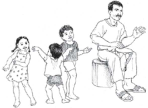
ຖ້າດົນຕີຢຸດ ໃຫ້ເດັກນ້ອຍ ພ້ອມກັນນັ່ງລົງ.

ຜູ້ໃຫຍ່ບາງຄົນອາດຮູ້ສຶກອິດອັດ ແລະ ບໍ່ຊົມເຄີຍທີ່ຈະເຂົ້າຮ່ວມກິດຈະກຳກັບເດັກນ້ອຍ. ແຕ່ວ່າດົນຕີ ສາມາດເຮັດໃຫ້ເດັກຮຽນຮູ້ການໝູນໃຊ້ຄວາມສາມາດໃນການໄດ້ຍົນຂອງເຂົາ ແລະ ກໍ່ເປັນສິ່ງດີທີ່ຈະນຳເອົາທັງຜູ້ໃຫຍ່ ແລະ ເດັກນ້ອຍມາຮ່ວມກິດຈະກຳນີ້. ໃຫ້ທ່ານຈົ່ງຄິດຊອກຫາບັນດາເພງທີ່ທ່ານເຄີຍຮ້ອງຕອນເປັນເດັກ ຫຼື ແອບຮ້ອງເພງທີ່ເດັກນ້ອຍຮູ້, ເລືອກເອົາເພງທີ່ມີຈັງຫວະມ່ວນຊື່ນ ແລະ ເພງທີ່ທຸກຄົນສາມາດຮ້ອງນຳກັນໄດ້. ທັງຜູ້ໃຫຍ່ ແລະ ເດັກນ້ອຍຄວນເຮັດກິດຈະກຳນີ້ຮ່ວມກັນ ແລະ ຖືວ່າກິດຈະກຳຮ້ອງເພງນີ້ເປັນກິດຈະກຳຂອງຄອບຄົວທີ່ຕ້ອງໄດ້ເຮັດທຸກໆມື້.