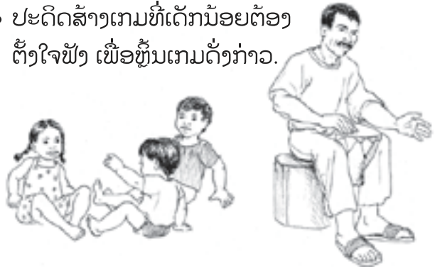
ເມື່ອເດັກນ້ອຍໄດ້ຍົນສຽງກອງ ໃຫ້ພວກເຂົາເຕັມ.