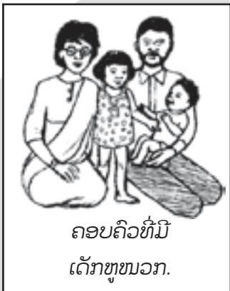
ຄອບຄົວທີ່ມີເດັກຫຼຸໜວກ.

ສິ່ງທີ່ຫລາຍຄົນນັບຖືວ່າແມ່ນຊຸມຊົນຂອງຕົນເອງທີ່ສຳຄັນແມ່ນລວມທັງເພື່ອນບ້ານ ໃກ້ຄຽງສະຖານທີ່ຢູ່ອາໄສ ແລະ ອື່ນໆ ແຕ່ນອກຈາກນີ້ ກໍຍັງມີຫລາຍປະເພດຊຸມຊົນນຳກັນ ເພາະ ຫລາຍກຸ່ມຄົນກໍສາມາດສະໜອງການອຸ້ມຊູແກ່ເດັກທີ່ຫຼຸໜວກ ແລະ ຄອບຄົວຂອງພວກເຂົາໄດ້ ເນື່ອງຈາກວ່າ ຄອບຄົວທີ່ມີລູກເປັນຄົນຫຼຸໜວກແມ່ນສັງກັດຢູ່ກັບຊຸມຊົນຫລາຍແບບນີ້ເອງໃນເວລາດຽວກັນ.