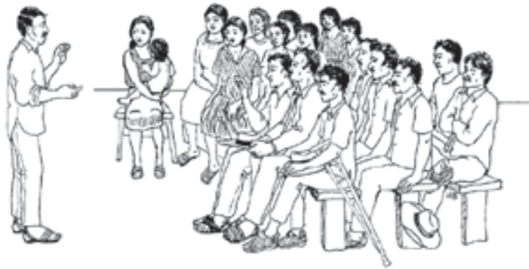
ມີຄົນຈຳນວນຫລາຍຂຶ້ນເລື້ອຍໆ ທີ່ເຂົ້າມານຳ ໃຊ້ຫ້ອງ ຮຽນພາສາສັນຍານ ເພື່ອຮູ້ວິທີການຕິດ ຕໍ່ກັບເດັກນ້ອຍ ແລະ ຜູ້ໃຫຍ່ທີ່ຫູໜວກ ເຊິ່ງອາ ໃສ່ຍູ່ໃນເມືອງ.

ສາສັນຍານ ສະມາຊິກຄອບຄົວຂອງຄົນຫູໜວກ. ສະມາຄົມພໍ່ ແມ່ຄົນຫູໜວກ ໄດ້ສະເໜີໃຫ້ລັດຖະ ບານ ຫ້ອງຖິ່ນ ເປີດໂຮງຮຽນສຳລັບເດັກທີ່ຫູ ໜວກ. ໂຮງຮຽນນີ້ໄດ້ຈ້າງຄູຝຶກອົບຮົມມາເປີດ ສອນ ໃຫ້ແກ່ເດັກຫູໜວກ. ຈາກນັ້ນ ເດັກຫູໜວກ ກໍສາມາດເຂົ້າຮ່ວມກິດຈະກຳຕ່າງໆ ກັບເດັກ ຫູດີ ທີ່ຮຽນໃນໂຮງຮຽນປົກກະຕິ. ອີກບໍ່ດົນ ຫມິດທັງ ເມືອງກໍເຫັນປ້າຍທີ່ໃຊ້ພາສາສັນຍານ ທົ່ວເມືອງ ບໍ່ ວ່າແຕ່ໃນໂຮງຮຽນ ແຕ່ຍັງໃຊ້ຕິດ ຫ້າງຮ້ານ ຂາຍເຄື່ອງ ແລະ ປ້າຍຖະໜົນຕ່າງໆ.