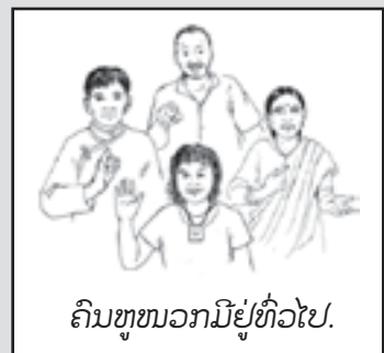
ຄົນຫຼຸໜວກມີຢູ່ທົ່ວໄປ.