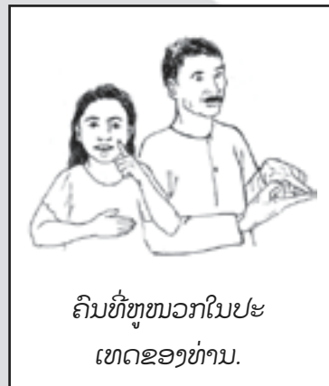
ຄົນທີ່ຫຼຸໜວກໃນປະເທດຂອງທ່ານ.