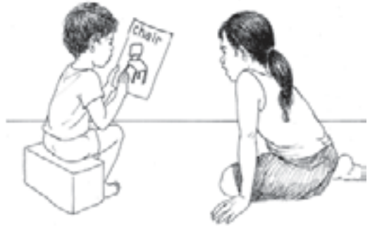
ເດັກທີ່ໃຫຍ່ກວ່າສາມາດຊ່ວຍເຫຼືອເດັກຮຸ່ນນ້ອງຮຽນອ່ານ ແລະ ຂຽນ.

ຜູ້ໃຫຍ່ຫຼືໜວກ ແມ່ນຄູທີ່ດີທີ່ສຸດຂອງເດັກຫຼືໜວກ. ໂຮງຮຽນທີ່ດີຄວນມີຜູ້ໃຫຍ່ຫຼືໜວກເຂົ້າຮ່ວມໃນຫ້ອງຮຽນເພື່ອເປັນອາຈານ, ຜູ້ແປ ແລະ ຜູ້ຊ່ວຍ. ຜູ້ໃຫຍ່ຫຼືໜວກ ເຂົ້າໃຈບັນຫາທີ່ເດັກຫຼືໜວກປະເຊີນຢູ່ ຜູ້ໃຫຍ່ຫຼືໜວກ ສາມາດກາຍເປັນຕົ້ນແບບໃຫ້ແກ່ເດັກຫຼືໜວກ ແລະ ສ້າງ ແນວຄິດທາງບວກໃຫ້ແກ່ເດັກກ່ຽວກັບຄົນຫຼືໜວກ.