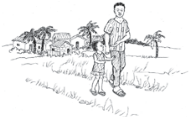
ການສຶກສາ, ເລີ່ມຕົ້ນໃນຫຼາຍສະຖານທີ່ຢູ່ໃນຫຼາຍໆສະຖານະການ ເຊັ່ນ: ຢູ່ທີ່ເຮືອນ, ຊຸມຊົນ ແລະ ໃນໂຮງຮຽນ.

ເຮົາຈະຊື້ປາຈຳນວນໜຶ່ງ ດ້ວຍເງິນນີ້ ຢູ່ທີ່ຕະຫຼາດ.