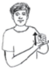
ຊ່ວຍເຫຼືອ