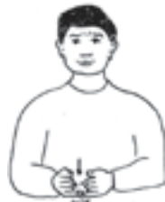
ເຈ້ຍ/ລະເມີດ