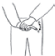
ອົງຄະຊາດ (ໂຄ້ຍ)