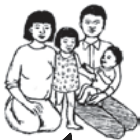
ລາວບໍ່ໄດ້ຮັບສານໄອໂອດີນພຽງພໍໃນນ້ຳ ແລະ ອາຫານ.