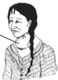
ພະຍາດຄໍໜຽງ

ໃນບາງເຂດຂອງໂລກ ດິນບັນຈຸສານອີອີດ ຢູ່ໃນທຳມະຊາດໜ້ອຍຫຼາຍ, ສະນັ້ນ ບັນດາປະເພດຜັກ ແລະ ພືດພັນຕ່າງໆທີ່ປູກໃນດິນ ດັ່ງກ່າວນັ້ນ ກໍ່ບັນຈຸສານໄອໂອດິນໜ້ອຍເຊັ່ນກັນ. ໃນບັນດາສະຖານທີ່ເຫຼົ່ານີ້ ການທີ່ມີຕອມຄໍໜ້ອຍ ຢູ່ໃນຄໍນັ້ນ ຖືວ່າເປັນເລື່ອງ ທຳມະດາ. ສິ່ງດັ່ງກ່າວນີ້ ເອີ້ນວ່າ: ພະຍາດຄໍໜຽງ. ຖ້າຫາກ ຫຼາຍໆຄົນທີ່ຢູ່ໃນຊຸມຊົນນັ້ນ ຫາກມີສິ່ງດັ່ງກ່າວ