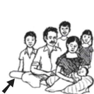
ລາວມີການຕິດເຊື້ອພະຍາດທາງຫຼຸຫຼາຍຊະນິດທີ່ບໍ່ໄດ້ຮັບການປິ່ນປົວ.

ສຸຂະພາບ ແລະ ການໄດ້ຍິນຂອງເດັກຈະໄດ້ຮັບຜົນປະໂຫຍດເມື່ອຊຸມຊົນມີອາກາດທີ່ບໍລິສຸດ (ປາສະຈາກຄວັນ ແລະ ຂີ້ຝຸ່ນ) ແລະ ການມີສຸຂະອະນາໄມທີ່ດີ, ປາສະຈາກຄວາມຮຸນແຮງ. ການສາທາລະນະສຸກທີ່ດີລວມໄປເຖິງການສຶກສາທາງດ້ານສະທາລະນະສຸກ, ການບໍ່ມີໂລກໄພໄຂ້ເຈັບ, ການປິ່ນປົວພະຍາດຕັ້ງແຕ່ຕົ້ນ. ສິ່ງເຫຼົ່ານີ້ແມ່ນກະແຈໄປສູ່ການປົກປ້ອງຄວາມສາມາດໃນການໄດ້ຍິນຂອງເດັກ.