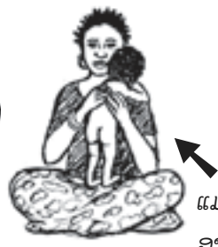
ແມ່ຂອງເຂົາບໍ່ໄດ້ກິນອາຫານ ຢ່າງພຽງພໍເມື່ອລາວຕັ້ງຄັນ.