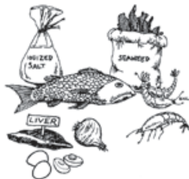
ອາຫານທະເລຈາກມະຫາສະໝຸດ, ຕັບ, ໄຂ່ແດງ ແລະ ຜັກປົວ ທີ່ບັນຈຸສານໄອໂອດິນ ຫຼາຍ.

ວິທີການທີ່ງ່າຍທີ່ສຸດ ເພື່ອໃຫ້ໄດ້ສານໄອໂອດິນ ທີ່ພຽງພໍນັ້ນ ແມ່ນການໃຊ້ສານໄອໂອດິນແທນເກືອຈາກທຳມະຊາດ ຫຼື ເກືອທີ່ມາຈາກຫີນ ເຊິ່ງທ່ານສາມາດຊອກຫາຊື້ເກືອໄອໂອດິນໄດ້ໃນເກືອບທຸກບ່ອນ.