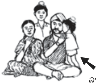
ລາວຕິດພະຍາດໝາກແດງ

ຄວາມເຊື່ອທີ່ຜິດ ບາງຄົນມີຄວາມເຊື່ອວ່າ ເດັກຫຼຸໜວກຍ້ອນ ພໍ່ແມ່ໄດ້ເຮັດສິ່ງໃດສິ່ງໜຶ່ງຜິດ, ອີກຈຳນວນໜຶ່ງເຊື່ອວ່າເດັກຫຼຸໜວກຍ້ອນມີຜູ້ໃດຜູ້ໜຶ່ງເຮັດໄສຍະສາດໃສ່ແມ່ຂອງເດັກ ແລະ ເດັກກໍຕ້ອງຄຳສາບເວດມິນຄາຖາ. ເຊິ່ງສິ່ງເຫຼົ່ານີ້ບໍ່ແມ່ນສາເຫດທີ່ເຮັດໃຫ້ເດັກຫຼຸໜວກ.