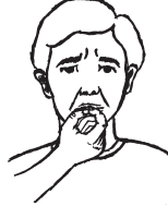
ຈາກປະເທດຈີນ