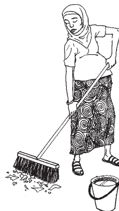
Цэвэрлэгээ хийснээр дахин тоостой холилдох асуудал үүсэхгүй болгох хэрэгтэй.

Даралттай агаар болон тоос үлээгчээр ажлын байр, тоног төхөөрөмж, шал эсвэл ажлын хувцсыг цэвэрлэж болохгүй. Ингэснээр тоосыг зүгээр л агаарт дэгдээж, түүгээр ажилчид буцаан амьсгалдаг