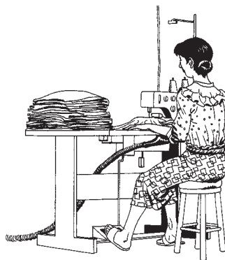
Суурилуулсан тоос татагч нь үүссэн тоосыг арилгана.

Сайн агааржуулалтын систем нь агаараас тоосыг сорон авч үйлдвэр болон ажилчдыг цэвэр, шинэ агаараар хангаж байдаг юм. Ажилчид ч бага тоосоор амьсгалж, тоног төхөөрөмж болон бусад талбайд тоос бага хуримтлагдах болно. Өөр өөр төрлийн агааржуулалтын системийн талаар илүү дэлгэрэнгүй мэдээлэл авахыг хүсвэл 17-р бүлгийг үзнэ үү.