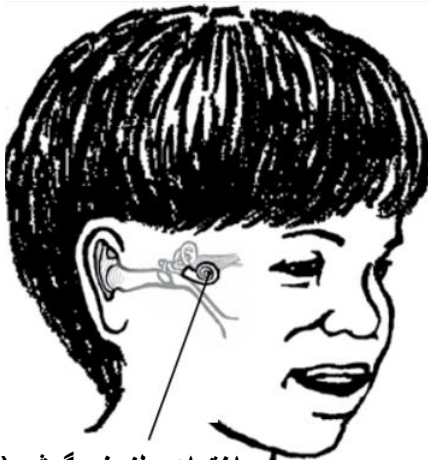
ساختمان حلزونی گوش (کوکلیا)

حلزون گوش یک قسمت کوچک گوش است که داخل سر می‌باشد. شکل آن مانند پوش حلزون می‌باشد.