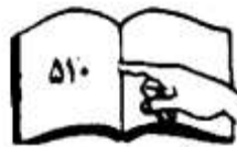
پاک نمودن و تعقیب

علامت انتان در هر زمان در جریان دو هفته اول بعد از ختنه ممکن مشاهده شوند.