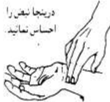
در اینجا نبض را احساس نمایید.

علامت هوشدار دهنده شاک موجودیت یک یا چند تاز از علامت: