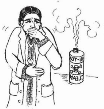
ساهه کڻڻ رستي (ساهه اندر ڪرڻ)