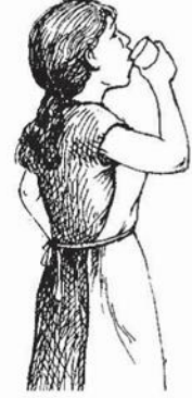
کائڻ ۽ پيئڻ رستي (گهٽ)

ڪو فرد، ڪنهن زهريلي ڪيميائي مادي سان جيترو وڌيڪ لاڳاپي ۾ ايندو يا منجهس سڌو سنئون وائڪو ٿيندو، ڪيس اوترو گهڻو نقصان پهچندو. ڀوپال ۾، 500000 ماڻهو هڪ ئي وقت رڳو هڪ دفعو زهريلي گئس ۾ وائڪا ٿيا ته اها، ساهه ۽ چمڙيءَ رستي سندن جسم ۾ داخل ٿي ويئي. اهو هڪدم پيدا ٿيندڙ هاجو هيو. جيئن ته ڪيميائي هاجي کي صاف ڪرڻ لاءِ ڪي به اڀاءَ نه ورتا ويا، ان سبب ڪارخاني جي چوگرد ڪيميائي زهر هنڌين ماڳين پکڙجي شهر جي زمين ۽ جر جي پاڻيءَ سان ملي ويو. اڄ به، ڪيترن سالن گذرڻ کانپوءِ ماڻهو اهڙو پاڻي پيئن ٿا جن ۾ زهر موجود آهي، جيڪو سانحي برقرار رهڻ جو هڪ حصو آهي.