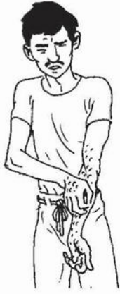
چمڙيءَ رستي (جذب ٿيڻ)